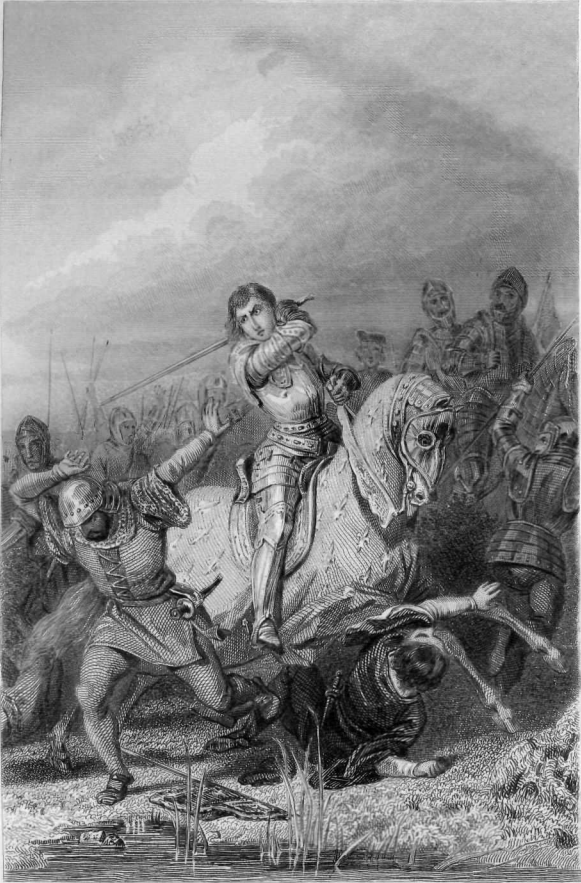
L. Girardet del.