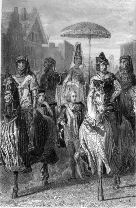
Le coroné de